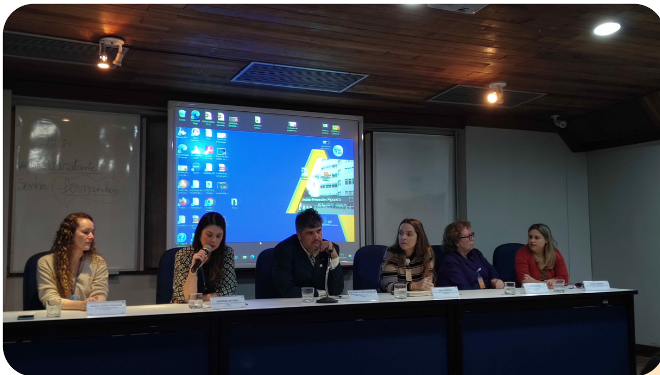
6ª edição do Fórum de Políticas Públicas para Crianças e Adolescentes com Doenças Crônicas e/ ou Deficiência e suas Famílias