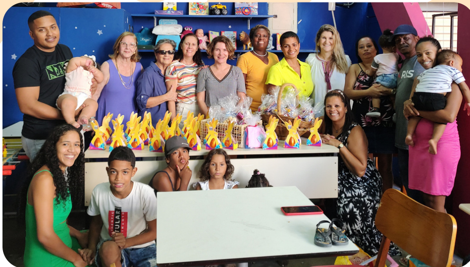
Páscoa da Família Refazer

E, em breve, vamos ganhar um vídeo institucional preparado pela Agência Rastro, que conheceu o nosso trabalho e decidiu apoiar a nossa causa.