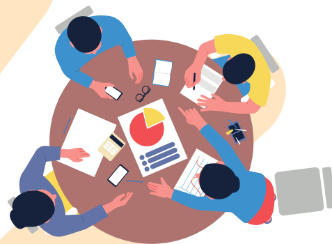
Arte do Canvas

E com a equipe do PAF (Plano de Atendimento Familiar), estamos elaborando oficinas e cursos de costura e informática para as famílias assistidas. Na captação de recursos, a interação entre as empresas e o Refazer será cada vez mais intensificada, promovendo ações entre o voluntariado e a visibilidade para a nossa causa. Vamos seguir trabalhando com todo o nosso empenho e dedicação.