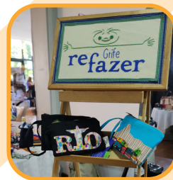
Pano de prato da Grife Refazer