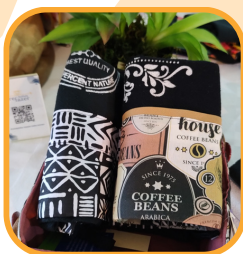
Pano de prato da Grife Refazer