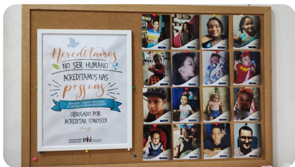
Quadro do Instituto Phi na entrada do Instituto Refazer.