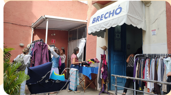
Brechozão de Inverno