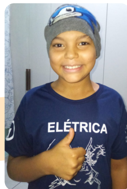
Projeto Fadas dos Sonhos aquecendo as nossas crianças.