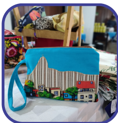
Necessaire da Grife Refazer