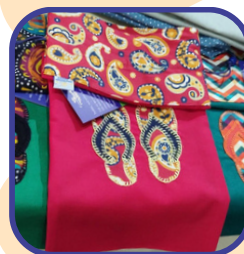
Porta havaianas da Grife Refazer