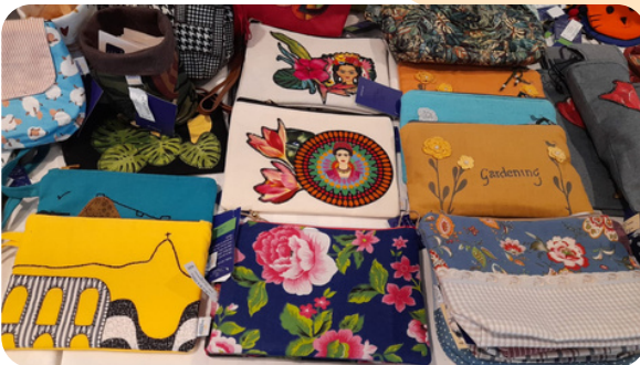
A Grife Refazer na Vale do Rio Doce