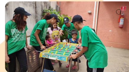
Ação com a Starbucks no Refazer