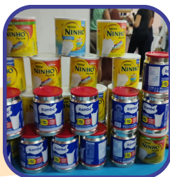
Entrega da lata de leite no Bazar