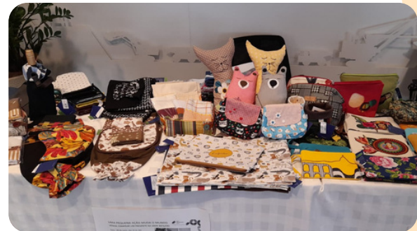
Os produtos da Grife Refazer