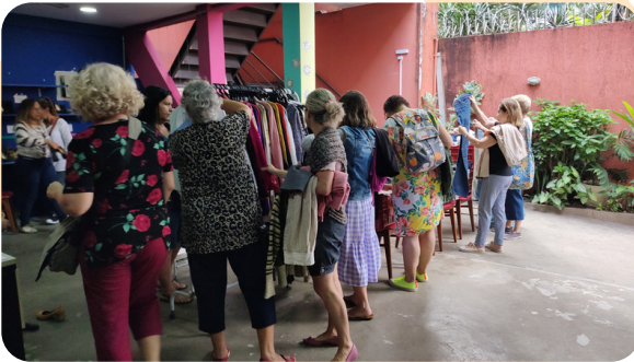
Brechozão na sede do Refazer

O primeiro Bazar do ano, no late Clube, foi recorde de vendas e de público. O Bazar no Jockey Club Brasileiro, pelo segundo ano consecutivo, foi um sucesso. Conseguimos atingir a nossa meta de captação de recursos para esse evento beneficente. São essas parcerias que nos ajudam a seguir em frente.