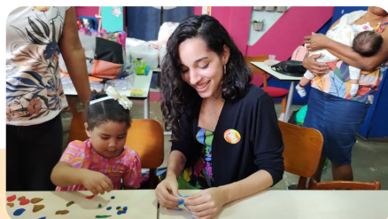
Recreação com a empresa Sitawi - Finanças do Bem