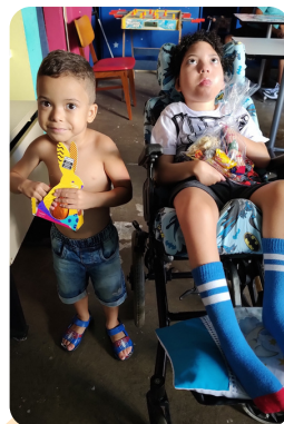
A criançada do Refazer com os ovos de páscoa que receberam da Igreja Messiânica.