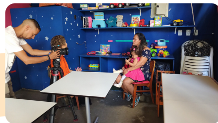
Gravação para o telejornal Bom Dia Rio da Rede Globo/RJ