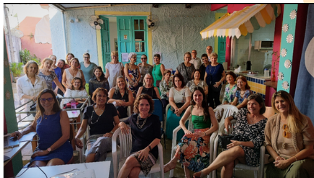
Assembleia com a participação dos voluntários do Refazer