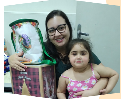
Entrega das cestas, chester e panetone