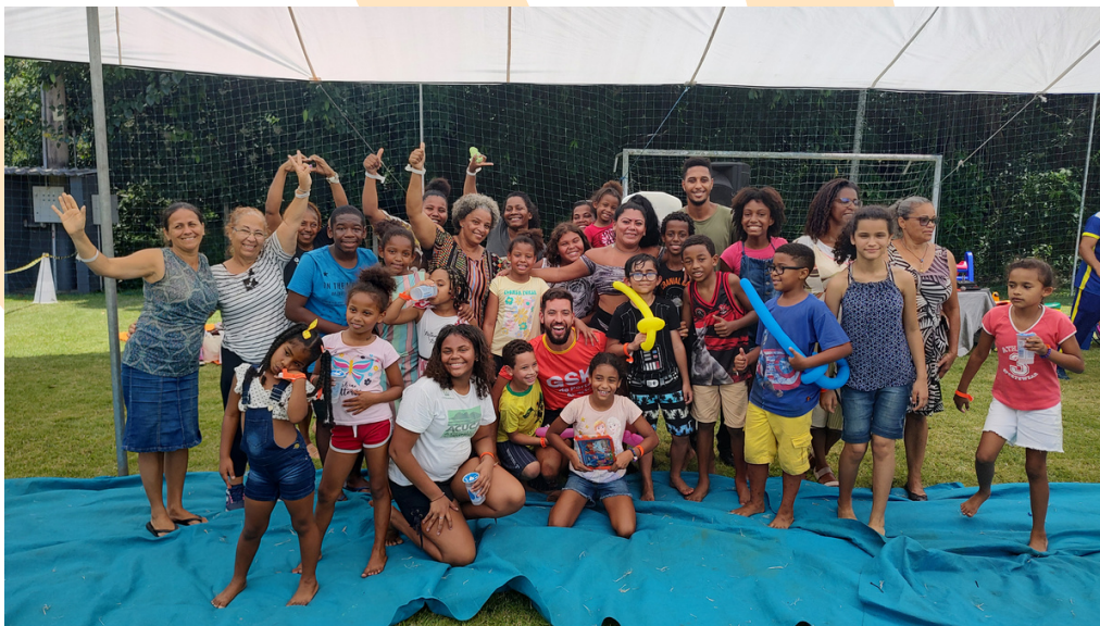
Aula de educação física com a criançada.