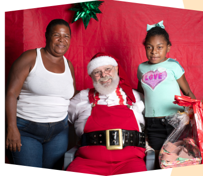
Entrega dos presentes e fotos com o papai Noel