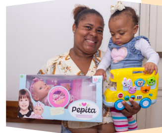
Entrega dos presentes Copastur - Agência de Turismo