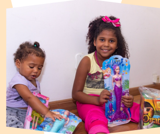
Entrega dos presentes Escola Trampolim