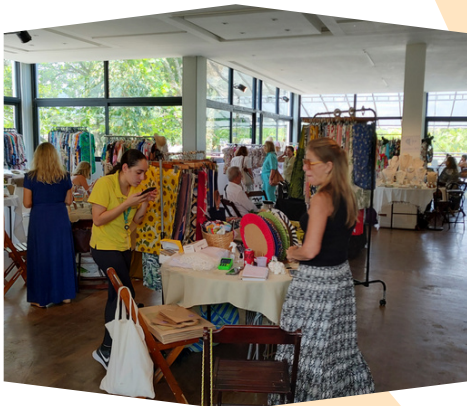
Edição do Bazar Beneficente no Jockey Club Brasileiro