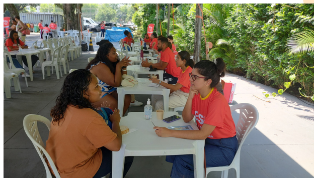
Equipe do Plano de Atendimento Familiar (PAF), do Refazer, participando do evento.