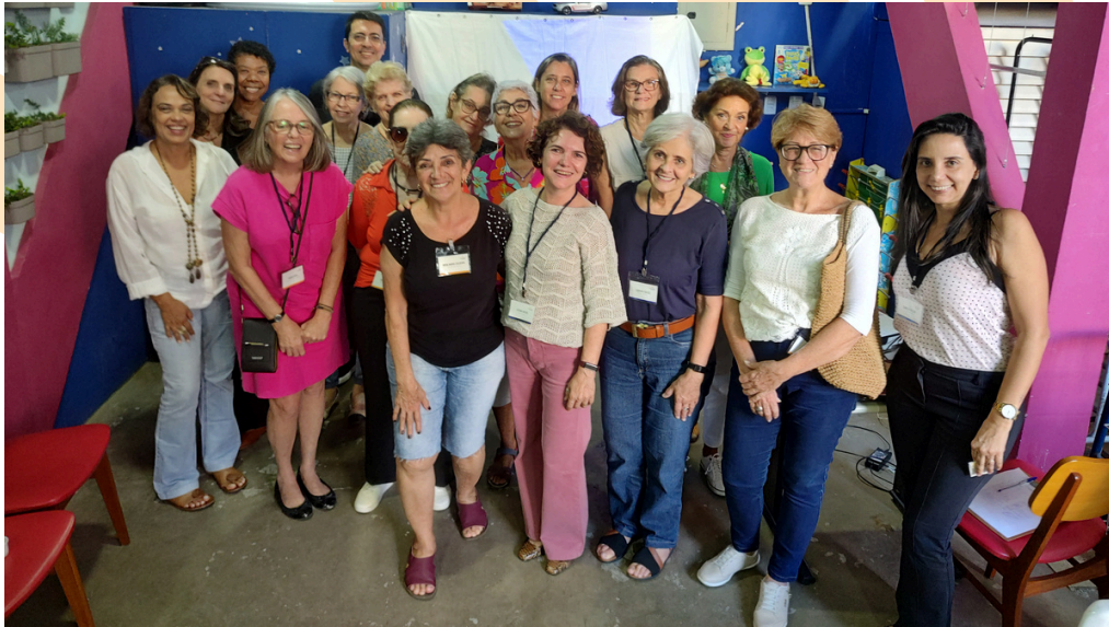
Assembléia Geral com os voluntários na sede do Instituto Refazer.