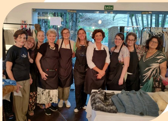
Nossas voluntárias no Bazar do Iate Clube.