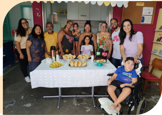
Café da Manhã para as Mães do Refazer.