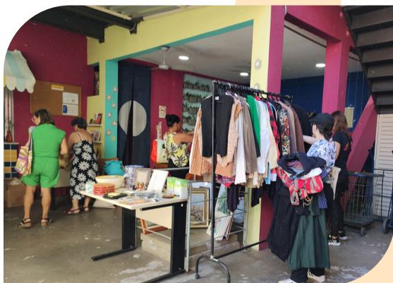
2º Brechozão do Refazer.

Cada evento realizado pelo Instituto Refazer é uma oportunidade de engajar, divulgar nossa causa e arrecadar os recursos necessários para continuar nosso trabalho. Esses eventos são fundamentais não apenas para a sustentabilidade financeira do Instituto, mas também para aumentar a visibilidade do nosso trabalho e sensibilizar mais pessoas sobre a importância do apoio às crianças e famílias que atendemos.