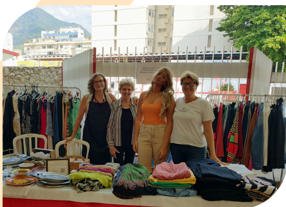
O Brechó do Refazer no Tijuca Tênis Clube.