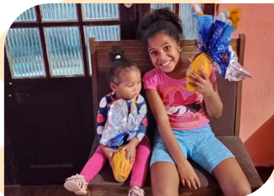
Entrega dos ovos de páscoa, presente do escritório Bichara Advogados.