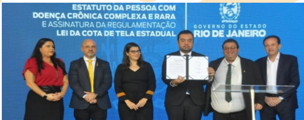
Lançamento da Campanha de Conscientização sobre o Estatuto da Pessoa com Doença Crônica Complexa e Rara: Governador Cláudio Castro apresenta o documento ao lado de autoridades e representantes da causa.