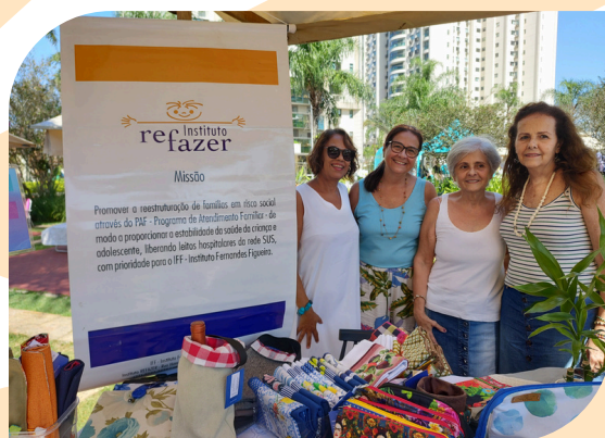
A Grife Refazer na Feira Buxixo.